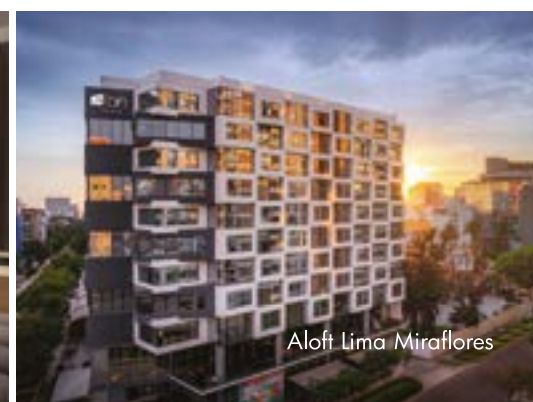
Aloft Lima Miraflores