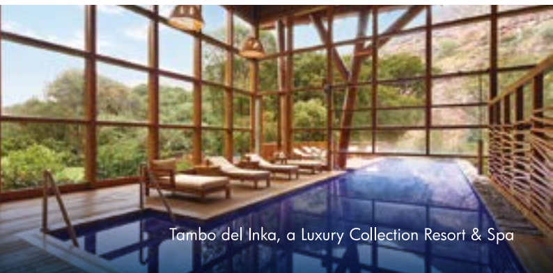
Tambo del Inka, a Luxury Collection Resort & Spa