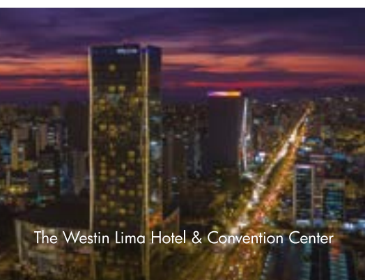
The Westin Lima Hotel & Convention Center