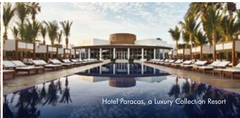
Hotel Paracas, a Luxury Collection Resort