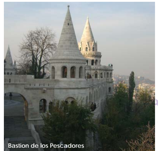
Bastion de los Pescadores